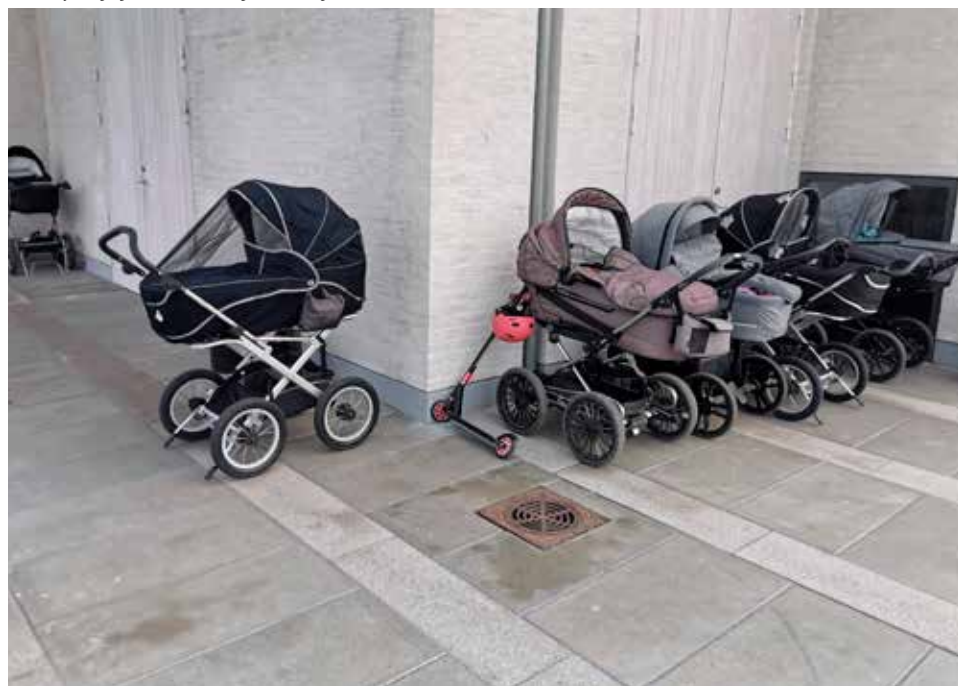
En del af "vognparken" ved babysalmesang i Østerhåb Kirke.

På hjemmesiden kan man også læse menighedsrådets årsberetning 2018 og få indblik i, hvad rådet har arbejdet med i det forgangne år.