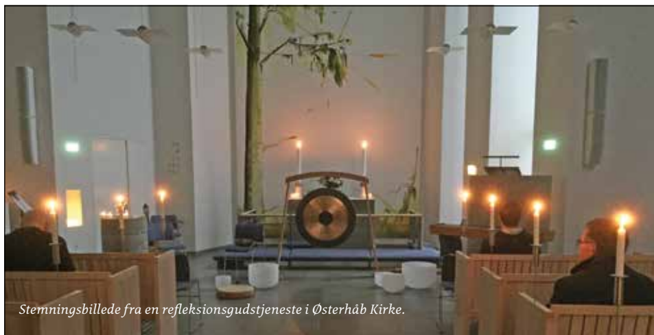
Stemmingsbillede fra en refleksionsgudstjeneste i Østerhåb Kirke.