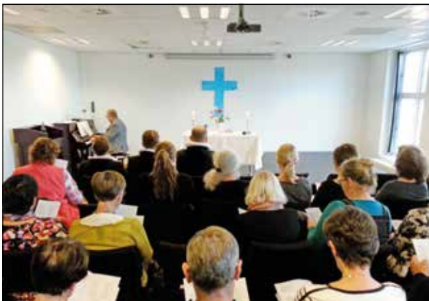
Møderummet blev omdannet til kirkesal ved søndagens gudstjeneste.