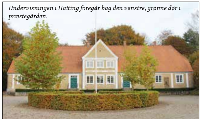
Undervisningen i Hatting foregår bag den venstre, grønne dør i præstegården.