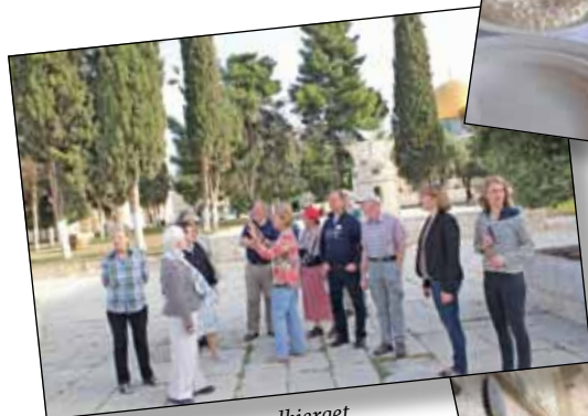
Tidlig morgen på Tempelbjerget.