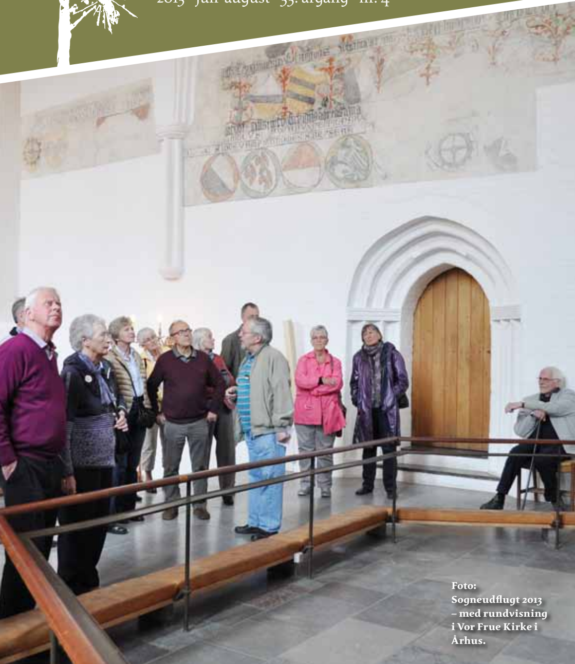
Foto: Sogneudflugt 2013 – med rundvisning i Vor Frue Kirke i Århus.