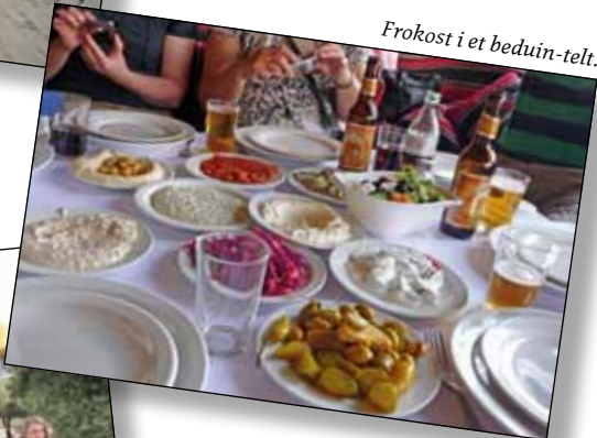
Frokost i et beduin-telt.