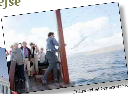
Fiskedræt på Genesaret Sø.