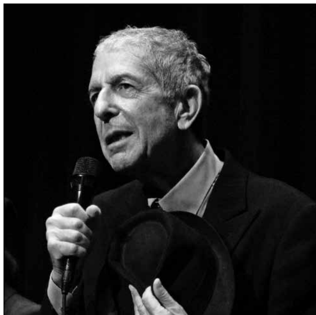
Leonard Cohen

Disneys "Frost", Narnia, Ringenes Herre, Astrid Lindgren, Svend Brinkmann og så mange andre bliver taget med på prædikestolen, eller i det mindste lagt ind i nogle præsters mentale bibliotek med fortællinger, der i virkeligheden – set med præstens skarpe blik handler om kristne temaer.