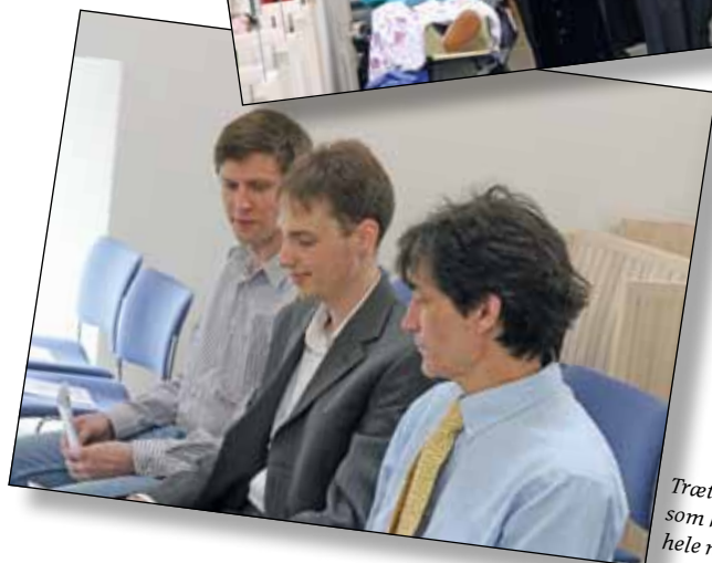
Trætte orgelbyggere, som havde arbejdet hele natten.