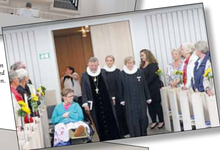
Biskop Kjeld Holm prædikede ved gudstjenesten.