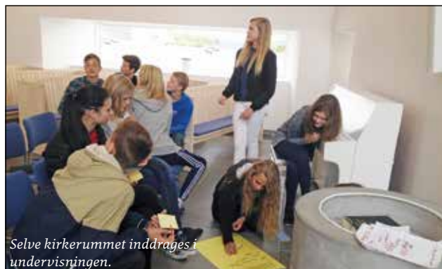
Selve kirkerummet inddrages i undervisningen.

fritidsaktiviteter som sport og arbejde. Skolereformen har også fået konsekvenser for udformningen af konfirmationsforberedelsen, som foregår på 8. klassetrin. Undervisningsministeren har understreget, at konfirmationsforberedelsen så vidt muligt skal placeres indenfor skoletiden, altså i tidsrummet mellem kl. 8 og 16. Placeringen af konfirmati-