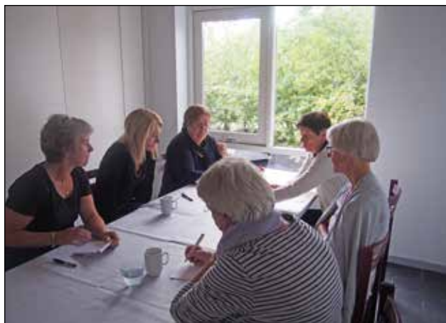
Der visioneres om sang og musik.

Visionsdøgn for menighedsråd og personale. Fredag den 22. august 2014 tog Torsted Menighedsråd og personalet i Torsted Sogn med bus til Pejsegården i Brædstrup. Vi skulle ud af de vante rammer, og sammen skulle vi idéudvikle og tale om kirken og dens liv i Torsted. Der kom mange spændende tanker og idéer på bordet, bl.a. blev der arbejdet med gudstjenesten. Er den god nok, som den er, eller ønsker vi nogle småjusteringer? Der var også idéer til familiesang for forældre og børn, ungdomsgudstjenester, meditationsguds-