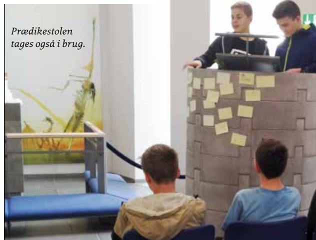
Prædikestolen tages også i brug.

fritidsaktiviteter som sport og arbejde. Skolereformen har også fået konsekvenser for udformningen af konfirmationsforberedelsen, som foregår på 8. klassetrin. Undervisningsministeren har understreget, at konfirmationsforberedelsen så vidt muligt skal placeres indenfor skoletiden, altså i tidsrummet mellem kl. 8 og 16. Placeringen af konfirmati-